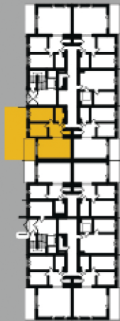
Polozenie na kondygnacji