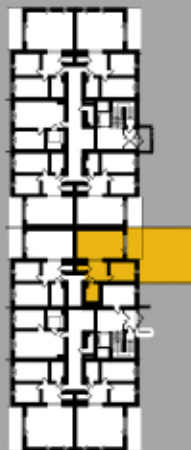
Położenie na kondygnacji